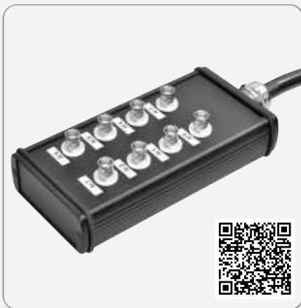
BNC Box - Link zum Shop