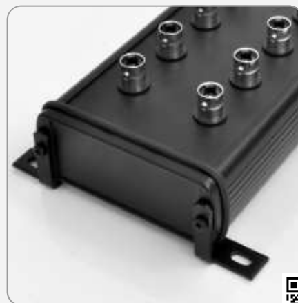
Halter für Trägerplatte