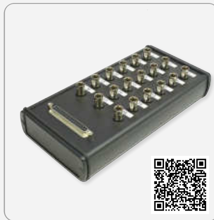
D-Sub Box - Link zum Shop