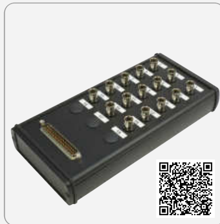
BNC Box SCSI - Link zum Shop

Ihre Wunsch-Breakoutbox ist nicht dabei? Bitte sprechen Sie uns an!