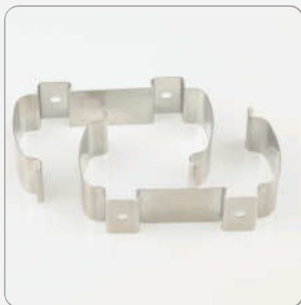
Befestigungsclips für Hutschiene